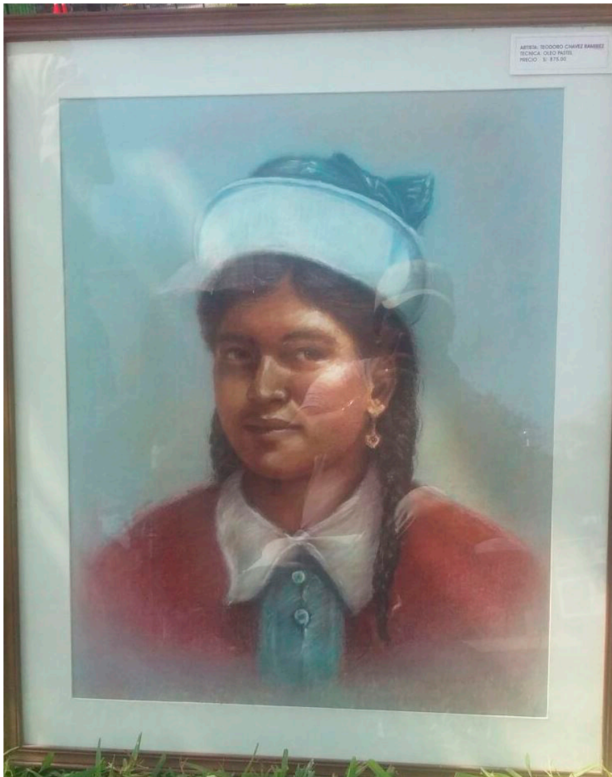
P 045 Mujer huancaína. Tiza pastel. 65 x 55 cm. S/. 1000